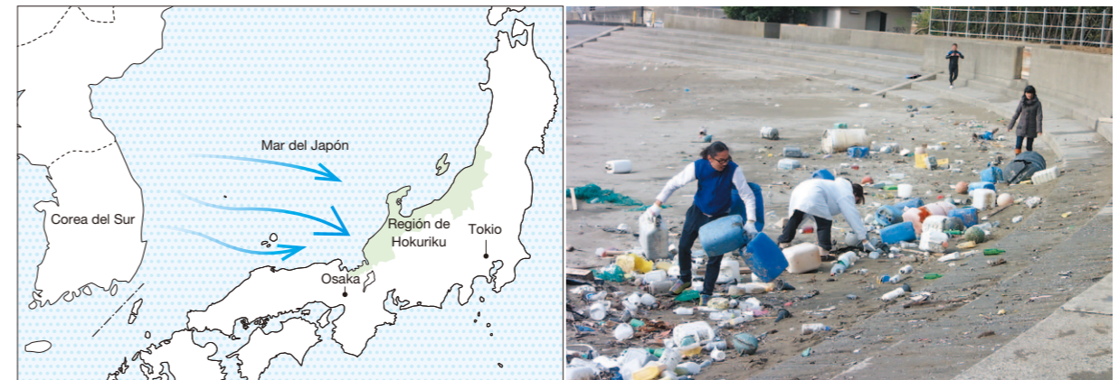
1 | 2 1. La región japonesa de Hokuriku está en la costa del Mar del Japón. 2. Las personas dedicadas a las tareas de limpieza no se sienten intimidadas por las ingentes cantidades de basura que llega a la costa.

Recientemente una iniciativa para cambiar el nombre del Mar del Japón por el de Mar del Este ha ganado popularidad en Estados Unidos. No obstante, deberíamos reflexionar sobre esto detenidamente. Si realmente nos preocupan estas aguas, preservar el entorno marino es mucho más importante que tratar de cambiar su nombre. El mar trasciende las fronteras nacionales. Cada persona que se beneficia de la riqueza del mar debería pensar sobre este como un todo al igual que los que viven al otro lado del mismo, y cooperar para proteger nuestro entorno marino global.