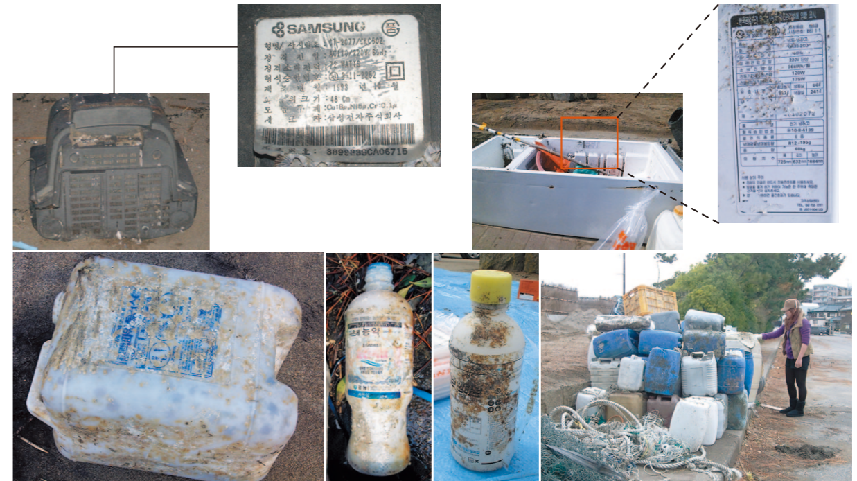
3 | 4 5 | 6 | 7 | 8 3. Un televisor fabricado en Corea del Sur arrastrado a la costa. 4. Incluso refrigeradores llegan a la playa. Las etiquetas de la mayoría de ellos están escritas en coreano. 5-8. Productos de plástico como barriles de polietileno o aparejos de pesca entre los que se incluyen cuerdas y boyas; son inorgánicos y, por lo tanto, no biodegradables. Una importante cantidad de basura, como botellas que contienen sustancias químicas que nadie querría tocar, llegan también a la costa.