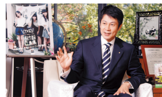
Gobernador Hidehiko Yuzaki

Nacido en Hiroshima en 1965. Se licenció en la Universidad de Tokio y obtuvo un máster en administración de empresas en la Universidad de Stanford. Fue nombrado gobernador de la prefectura de Hiroshima por primera vez en 1993. “He trabajado para potenciar las cualidades especiales de Hiroshima, colaborando con el Gobierno central para dar a las regiones lo que merecen y corregir la excesiva concentración de recursos en Tokio. Centro mis esfuerzos en pulir el atractivo de la región como destino de inversión. Como líder regional en Japón, hago todo lo posible por convertir el potencial en una realidad.”