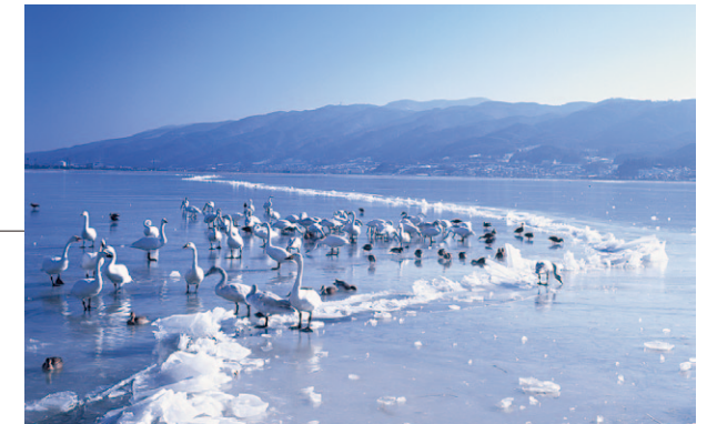
La travesía de dios: lago Suwa, Nagano

Designada como Patrimonio de la Humanidad, la aldea histórica de Shirakawa-gō se caracteriza por sus tradicionales casas de estilo gasshō . Sus tejados de chamiza marcadamente inclinados están diseñados para soportar las fuertes nevadas. En el pasado, los lugareños criaban gusanos de seda en el espacio del ático. La nieve que cae suavemente sobre la aldea revela una escena realmente serena.