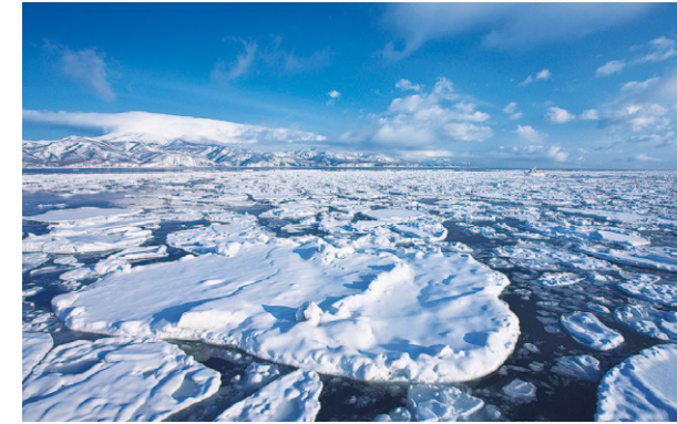
Hielo flotante: Abashiri, Hokkaidō

El Jigokudani Yaen-Kōen es el único lugar en el que pueden ver a monos japoneses tomando un baño en las aguas termales naturales. Conocidos popularmente como “monos de las nieves”, parecen casi humanos cuando se relajan en las cálidas aguas —una visión adorable que con seguridad les emocionará.