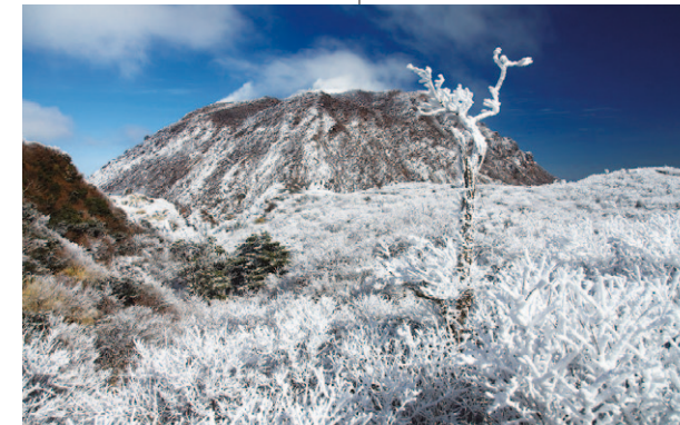
Escarcha dura: monte Myōkendake, Nagasaki

El invierno llega incluso a la isla más meridional de Kyūshū, produciendo una bella e impresionante estampa invernal. Los árboles se cubren de escarcha dura —cristales de hielo que se forman por las pequeñas gotas de agua que hay en el aire. No obstante, solo puede ser vista bajo unas condiciones adecuadas, que incluyen bajas temperaturas, fuertes vientos y niebla.