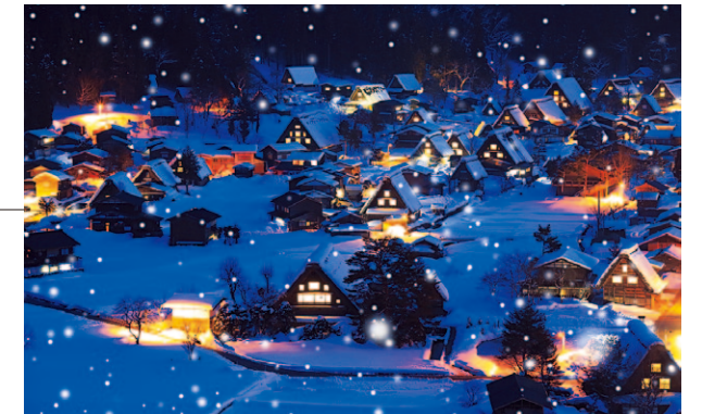
Aldea histórica: Shirakawa-gō, Gifu

La cencellada blanca que cubre la meseta de Zaō es una obra de arte de la naturaleza en la que se unen clima y vegetación. Esquiar entre los imponentes gigantes —también conocidos como “monstruos de la nieve”— es una experiencia única y emocionante.