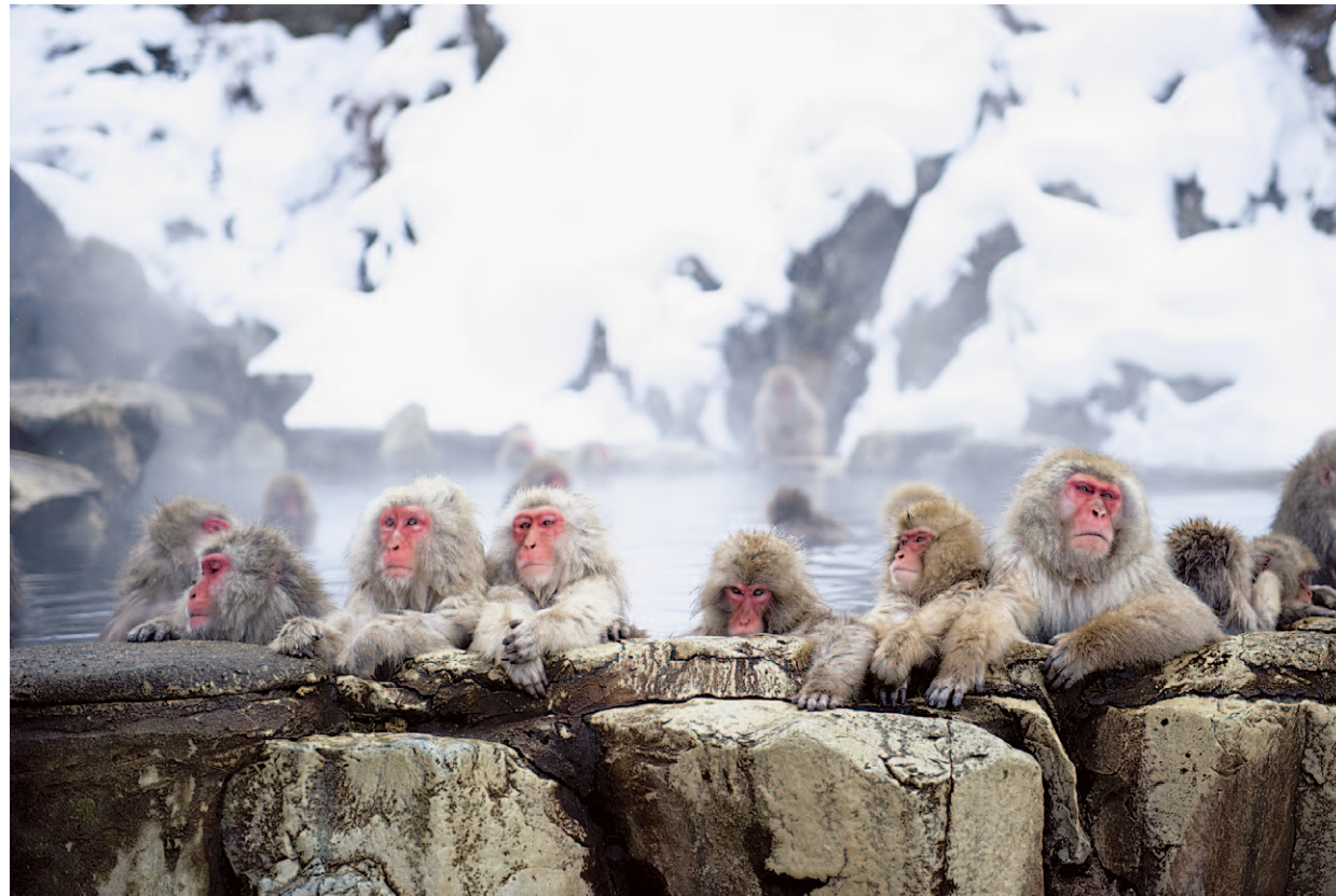
Monos de las nieves: Jigokudani Yaen-Kōen (parque de los monos de las nieves), Nagano

Vengan y descubran por sí mismos los peculiares paisajes cubiertos de nieve de las ciudades, los pueblos y las montañas de Japón, donde la vida de las personas se entrelaza con la naturaleza.