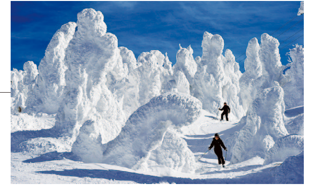
Escarcha blanca: Zaō, Yamagata

El invierno llega incluso a la isla más meridional de Kyūshū, produciendo una bella e impresionante estampa invernal. Los árboles se cubren de escarcha dura —cristales de hielo que se forman por las pequeñas gotas de agua que hay en el aire. No obstante, solo puede ser vista bajo unas condiciones adecuadas, que incluyen bajas temperaturas, fuertes vientos y niebla.